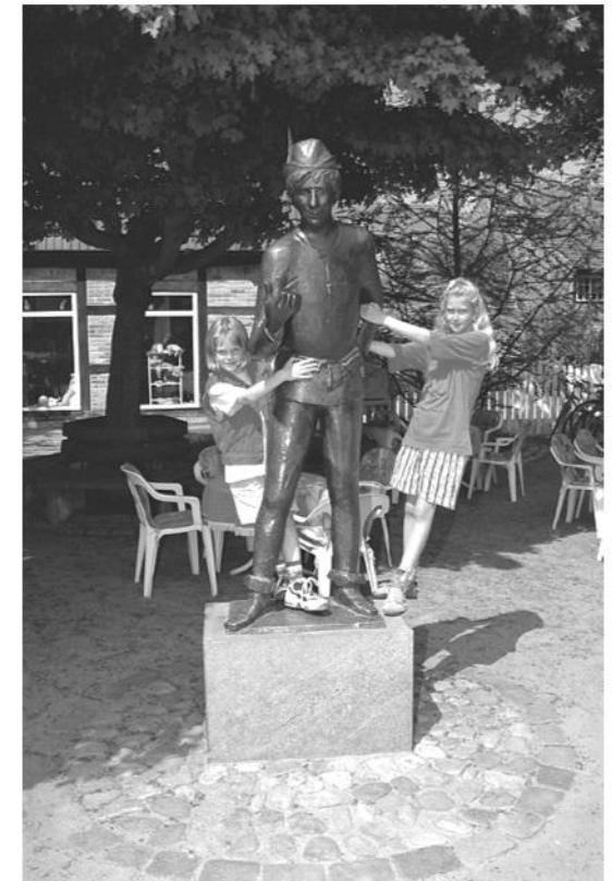
- Karlheinz Goedtkes Werke in Eutin -