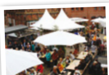
Markt der Begegnungen

Dass dabei Menschen mit Behinderung mittendrin sind, ist inzwischen eine „besondere Selbstverständlichkeit“ für das Altstadtfest.